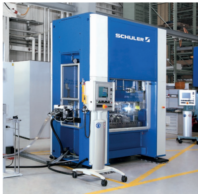
Schnellstanzautomat MCF 80.

Mit den Schnellstanzautomaten MCF lassen sich feine Bauteile mit geringem Schnittspalt mit bis zu 300 Hüben pro Minute produzieren.