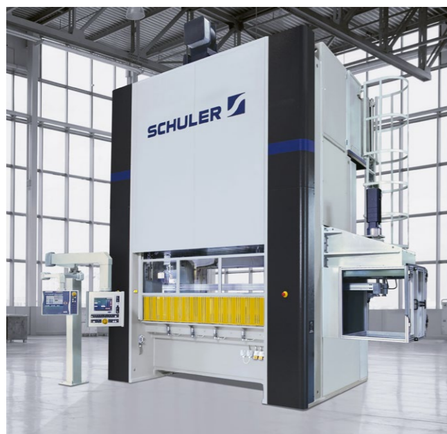
Stanzautomat MC 300 mit Transfer.

Die Monoblock-Maschinen zum Stanzen klassischer Blechteile zeichnen sich durch hohe Ausbringung, lange Werkzeugstandzeiten und präzise Bauteile aus.