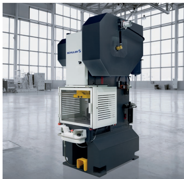
CBL 40h mit Fusspedal.